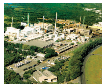
Rodovia BA 099, km 20, Abrantes Camaçari, BA. CEP 42.829-710 Brasil